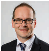
Grant Hendrik Tonne Niedersächsischer Kultusminister

Auf dieser Grundlage werden Sie eine fundierte Entscheidung für den weiteren Bildungsweg Ihres Kindes treffen können. Ein glückliches Kind, das den Anforderungen der gewählten Schulform motiviert begegnet, sollte das gemeinsame Ziel sein.